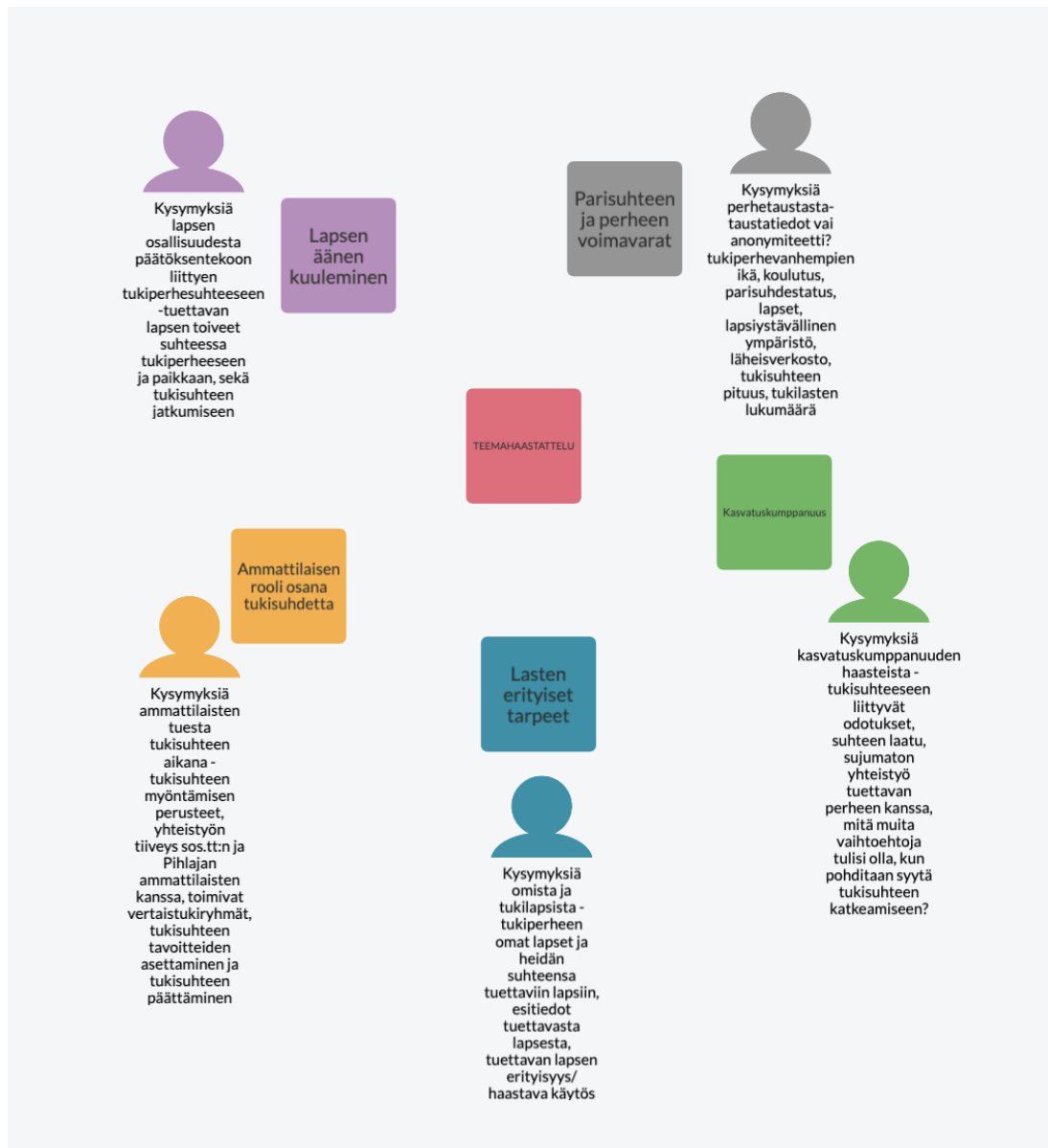
Kuvio 2: Flinga-näkymä teemaahaastattelun alussa

Ensimmäisenä teemana käsittelemme parisuhteen ja perheen voimavaroja. Sisällytimme tähän teemaan kysymyksiä perhetaustasta, esimerkiksi kysymykset tukiperhelasten lukumäärästä sekä siitä, ovatko tukiperheet toimineet tukiperheenä läheisverkostosta. Teemasta nousi esille, että olisi tärkeää kysyä ainakin tukivanhemman sukupuolta ja talouden kokoa (yhden vai kahden vanhemman talous), koska tukiperheeltä voidaan odottaa mm. miehenmallia ja lisäksi yksin tukiperheenä toimiminen voi kasvattaa uupumisen riskiä. Lisäksi tulisi kysyä tukiperheen omien lasten lukumäärää sekä selvittää, onko tuettavan perheen lasten määrällä vaikutusta tukisuhteen onnistumiselle. Esimerkkinä nostettakoon, että kyselylomakkeessa olisi syytä kysyä, oliko päättyneessä tukisuhteessa yksi lapsi vai sisarukset. Ehdotimme myös korjauksia jo aikaisemmin käytössä olleisiin kysymyksiin, kuten kysymykseen: Kuinka monta tuettavaa lasta perheessänne on ollut Pihlajan kautta? Mielestämme kysymys jätti