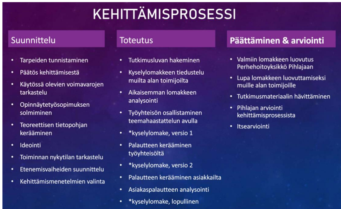
Kuvio 1: Kehittämisprosessi lineaarisena kaaviona

Kehittämistoimintaa voidaan ajatella pitkälti sosiaalisena prosessina, joka edellyttää vuorovaikutusta ja osallistumista. Niin asiakkaiden kuin työntekijöiden osallistumisesta on monia hyötyjä kehittämisprosessissa. Olennaista on saada kehittämisprosessiin osalliseksi heidät, joita asia koskee. (Toikko & Rantanen 2009, 89-90.)